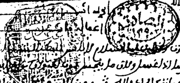
الصفحة الأولى من نسخة «ب» عند إلحاقها بالمكتبة. وعليها نص وختم التحجيس.